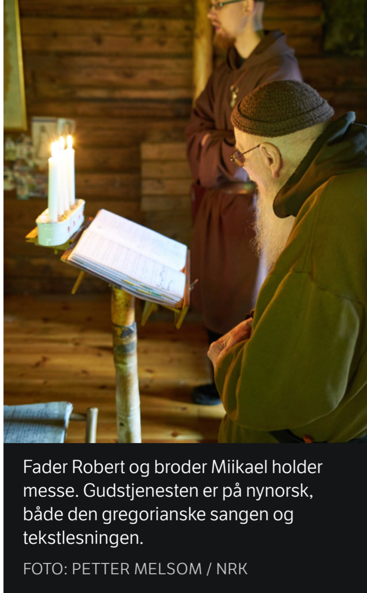
Fader Robert og broder Miikael holder messe. Gudstjenesten er på nynorsk, både den gregorianske sangen og tekstlesningen.

– Her i Telemark fant jeg det jeg lette etter: En mulighet til å få leve i stillhet og bønn, sier han.