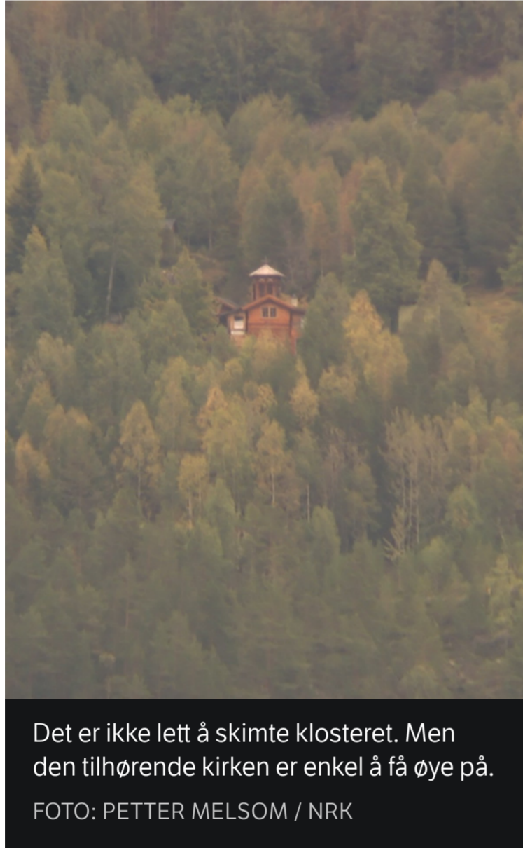
Det er ikke lett å skimte klosteret. Men den tilhørende kirken er enkel å få øye på.

Miikael dro til Telemark for godt i 2009. Nå snakker han flytende nynorsk, og siden han er musikkinteressert har lært seg å steve på klingende telemarksdialekt.