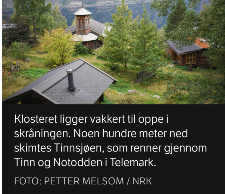
Klosteret ligger vakkert til oppe i skråningen. Noen hundre meter ned skimtes Tinnsjøen, som renner gjennom Tinn og Nolodden i Telemark.

– Munkene i Tinn er spesielle. De er få og måten de har bygd opp sitt lille kloster på finnes det ikke maken til her i landet. Det som kommer nærmest er Munkeby kloster i Levanger. De er også cisterciensere i likhet med munkene ved Tinnsjøen, sier Schumacher.